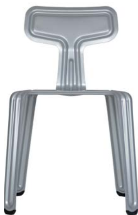
pulverbeschichtet silber powder coated silver