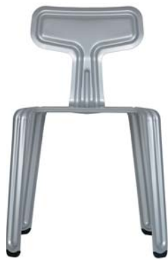
pulverbeschichtet silber powder coated silver ca. RAL 9006