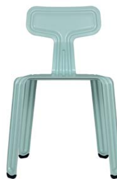
Frühtau-Blau morning-dew-blue NCS S 1515-B50G