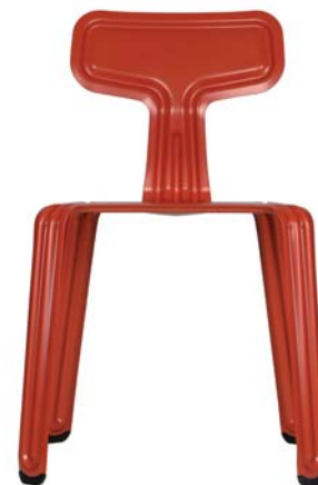
pulverbeschichtet rot powder coated red