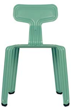
Tussi-Türkis drama-queen-green NCS S 3030-B70G