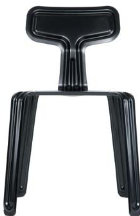
pulverbeschichtet schwarz powder coated black