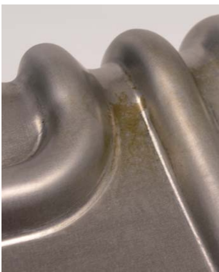
1 - 3 Pressspuren/ marks of pressing