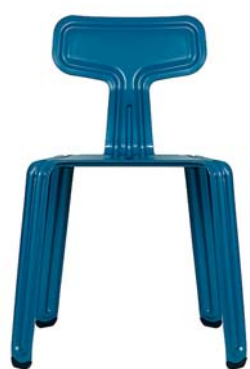
Stille-Wasser-Blau still-water-blue NCS S 6020-R90B

pulverbeschichtet matt/powder coated, matt finished