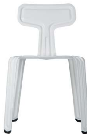
pulverbeschichtet weiß powder coated white