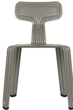
Chiemsee-Schlick lake-Chiemsee-silt NCS S 6005-Y20R