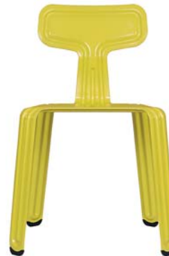
Scharfer-Senf hot-mustard NCS S 10602-G90Y

Sonderfarben (RAL-Farbtöne) sind möglich special colours (RAL colour) are possible