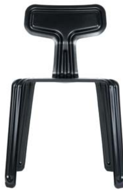
pulverbeschichtet schwarz powder coated black RAL 9005