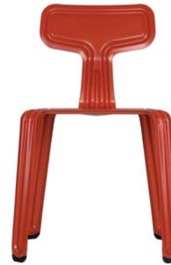
pulverbeschichtet rot powder coated red RAL 3000