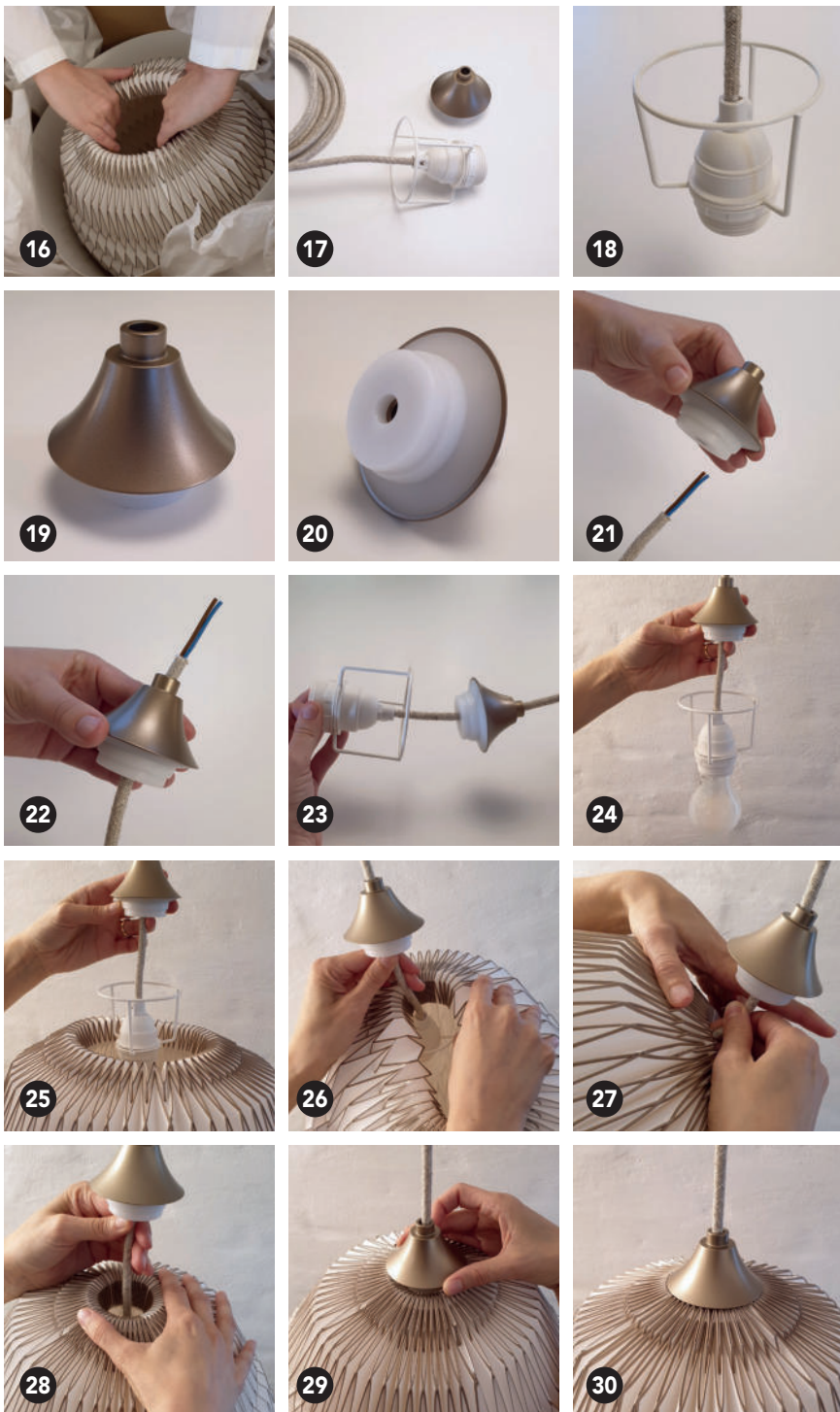
Billeder til brug ved montage af én person.