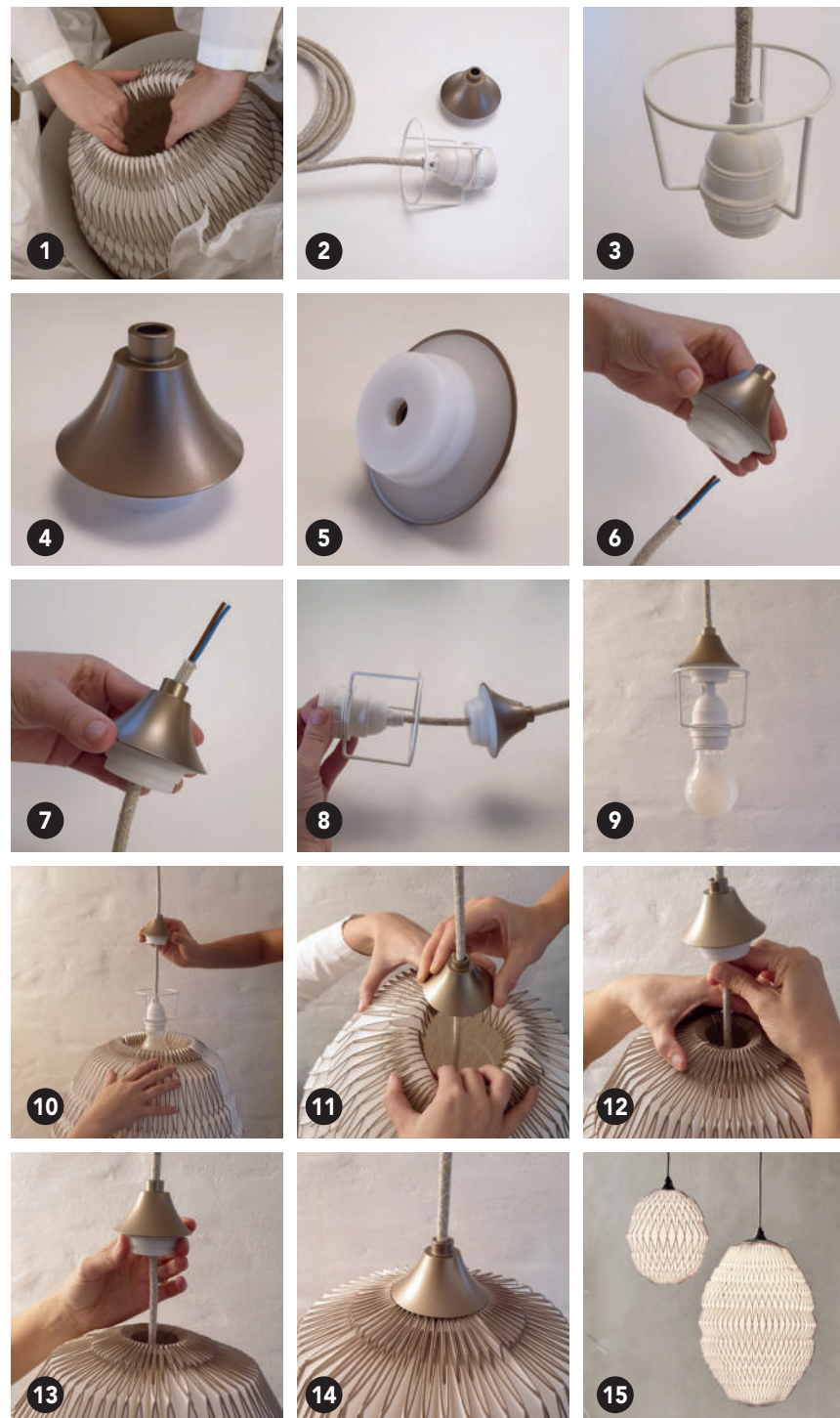
Billeder til brug ved montage af to personer.

Hvis du er alene om montagen anbefaler vi, at du støtter skærmen op af din overkrop og følger anvisningerne på billederne 16-30.