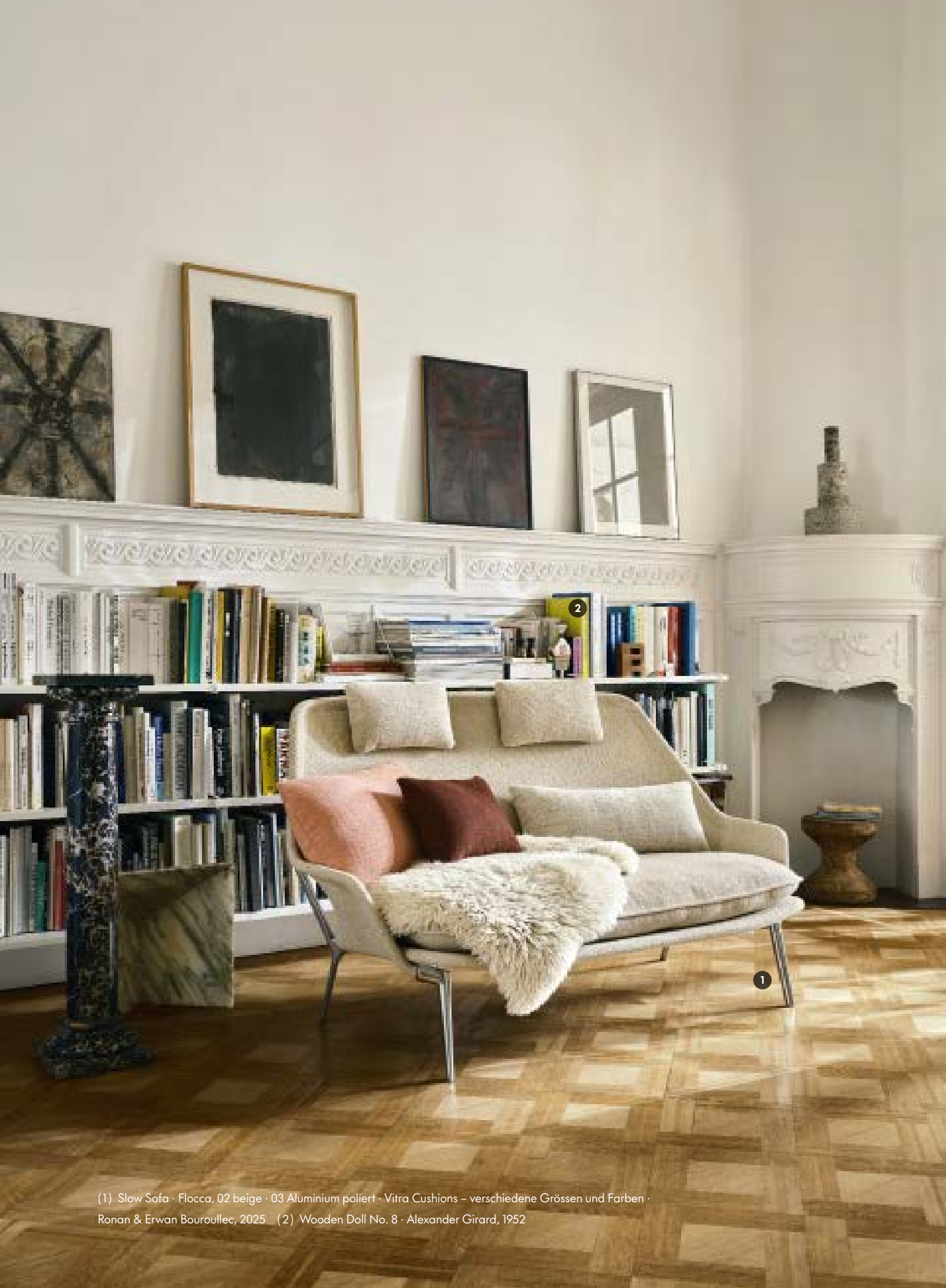
(1) Slow Sofa · Flocca, 02 beige · 03 Aluminium poliert · Vitra Cushions – verschiedene Grössen und Farben · Ronan & Erwan Bouroullec, 2025 (2) Wooden Doll No. 8 · Alexander Girard, 1952