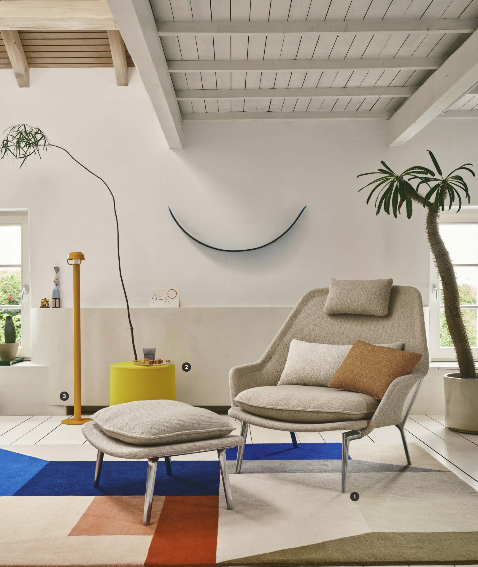
(1) Slow Chair & Ottoman · Flacca, 02 beige · 03 Aluminium poliert · Vitra Cushions – verschiedene Grössen und Farben · Ronan & Erwan Bouroullec, 2006 (2) Visiona Stool – Home Selection · Kvadrat, Vidar 4, col. 0443 · Verner Panton, 1970/2012 (3) Artek Kori Floor Light · hell matt orange · TAF Studio, 2023