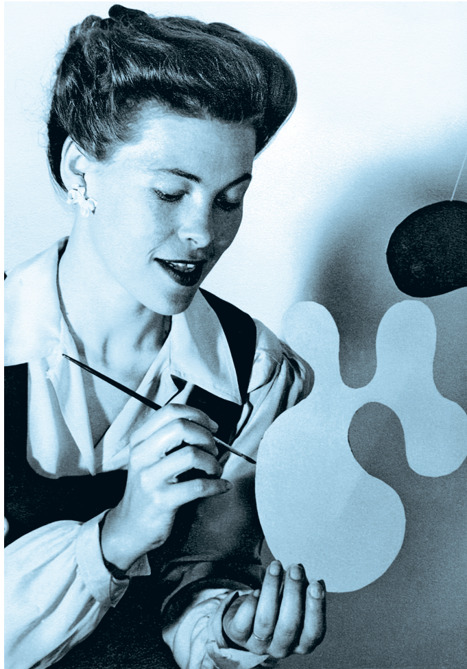
Ray Eames arbeitet an einem Mobile, 1940er-Jahre.

Zu Beginn der 1940er-Jahre arbeiteten Charles und Ray Eames an einer Reihe von Experimenten, mit denen sie die Technik der Schichtholzverformung vorantreiben wollten. In dieser Zeit entstand ein Objekt, das in seiner Formgebung stark an Rays Kunstwerke und Grafiken erinnert und das die Eames in ihrem Appartement in Los Angeles als Mobile aufhängten.