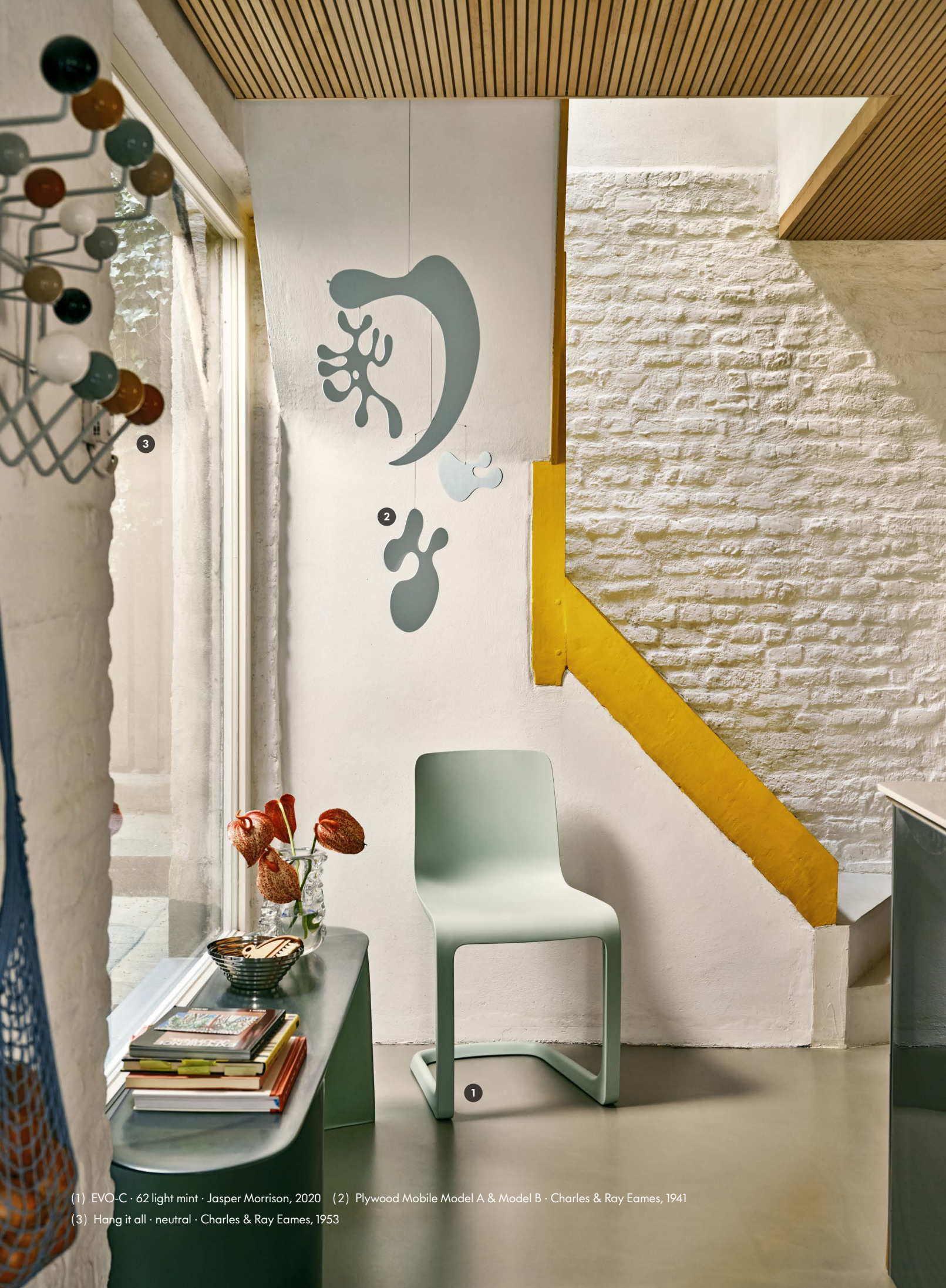
(1) EVO-C · 62 light mint · Jasper Morrison, 2020 (2) Plywood Mobile Model A & Model B · Charles & Ray Eames, 1941 (3) Hang it all · neutral · Charles & Ray Eames, 1953