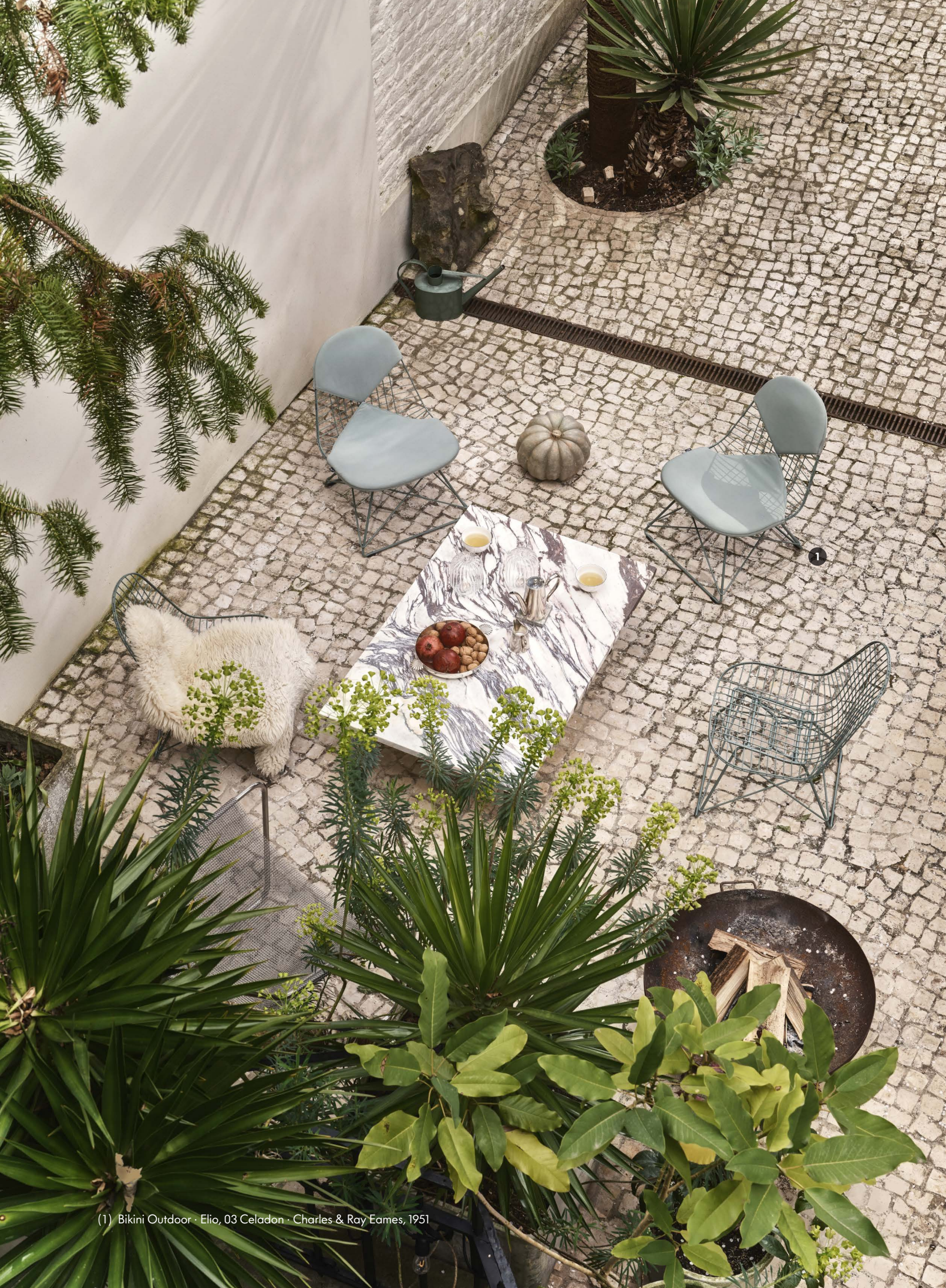
(1) Bikini Outdoor - Elio, 03 Celadon - Charles & Ray Eames, 1951