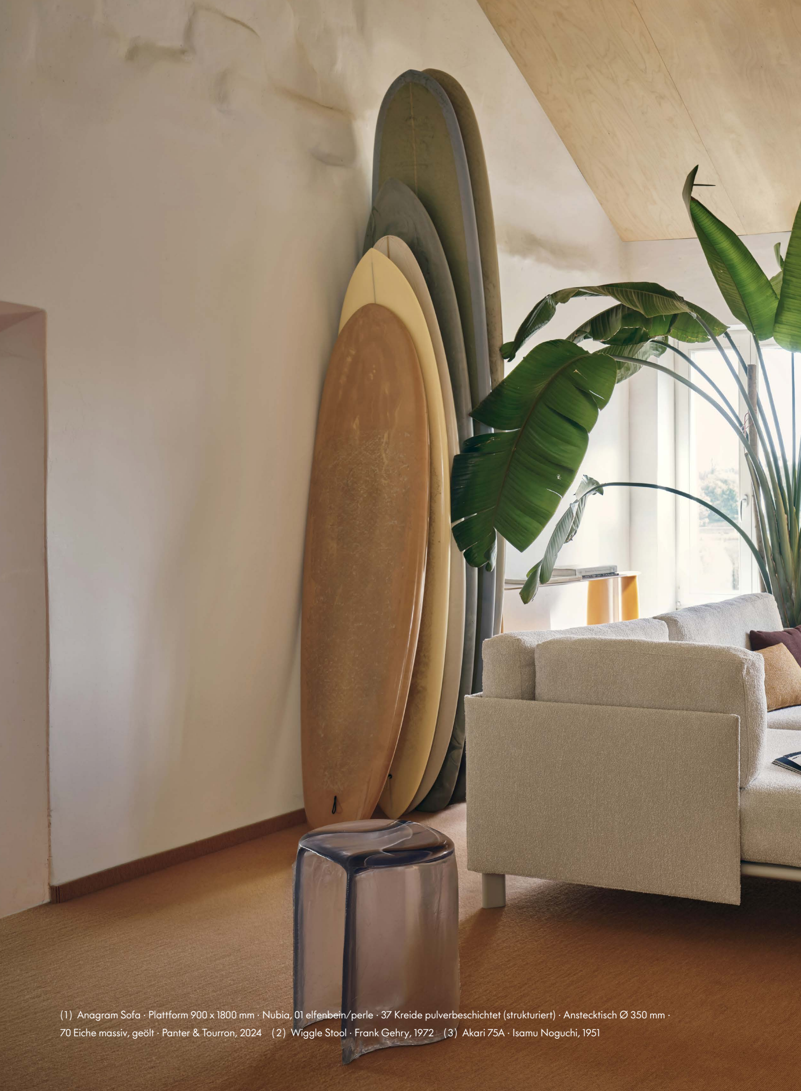
(1) Anagram Sofa · Plattform 900 x 1800 mm · Nubia, 01 elfenbein/perle · 37 Kreide pulverbeschichtet (strukturiert) · Anstecktisch Ø 350 mm · 70 Eiche massiv, geölt · Panter & Tourron, 2024 (2) Wiggle Stool · Frank Gehry, 1972 (3) Akari 75A · Isamu Noguchi, 1951