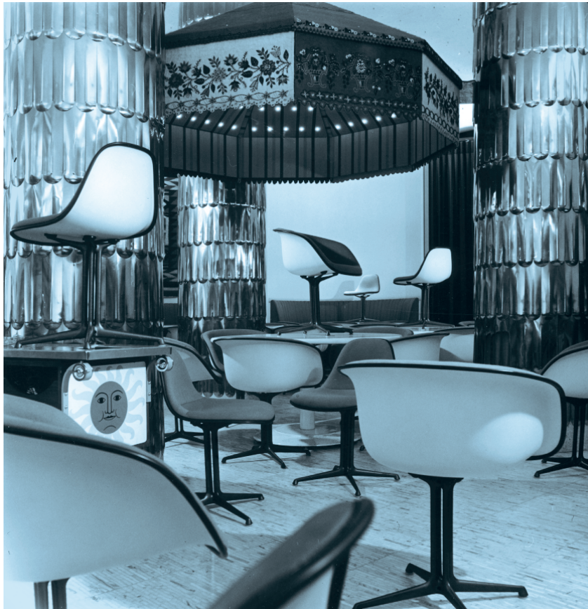
Das Restaurant La Fonda del Sol, New York City, 1960.

Das Konzept des La Fonda-Untergestells haben Charles und Ray Eames bereits 1948 für die 1950 vorgestellten Plastic Chairs entwickelt. Die endgültige Form haben sie 1960 vollendet, als ihr Freund, der Designer und Innenarchitekt Alexander Girard, passende Stühle für die Einrichtung des Restaurants La Fonda del Sol im Time Life Building in New York City benötigte. Mit seiner zentralen Säule aus vier Strängen, die sich unten in einen Viersternfuss teilen, ist das La Fonda eines der elegantesten und unkonventionellsten Untergestelle, das die Eames entworfen haben. Da sie stets bestrebt waren, komplette Designlösungen zu entwickeln, nahmen sie das neue Gestell in ihre gesamte Kollektion der Shell Chairs auf. Bislang hat Vitra es nur für den Plastic Armchair RE DAL und für eine limitierte Edition des Fiberglass Side Chair DSL mit Stoffpolstern in einem Girard-Muster angeboten.