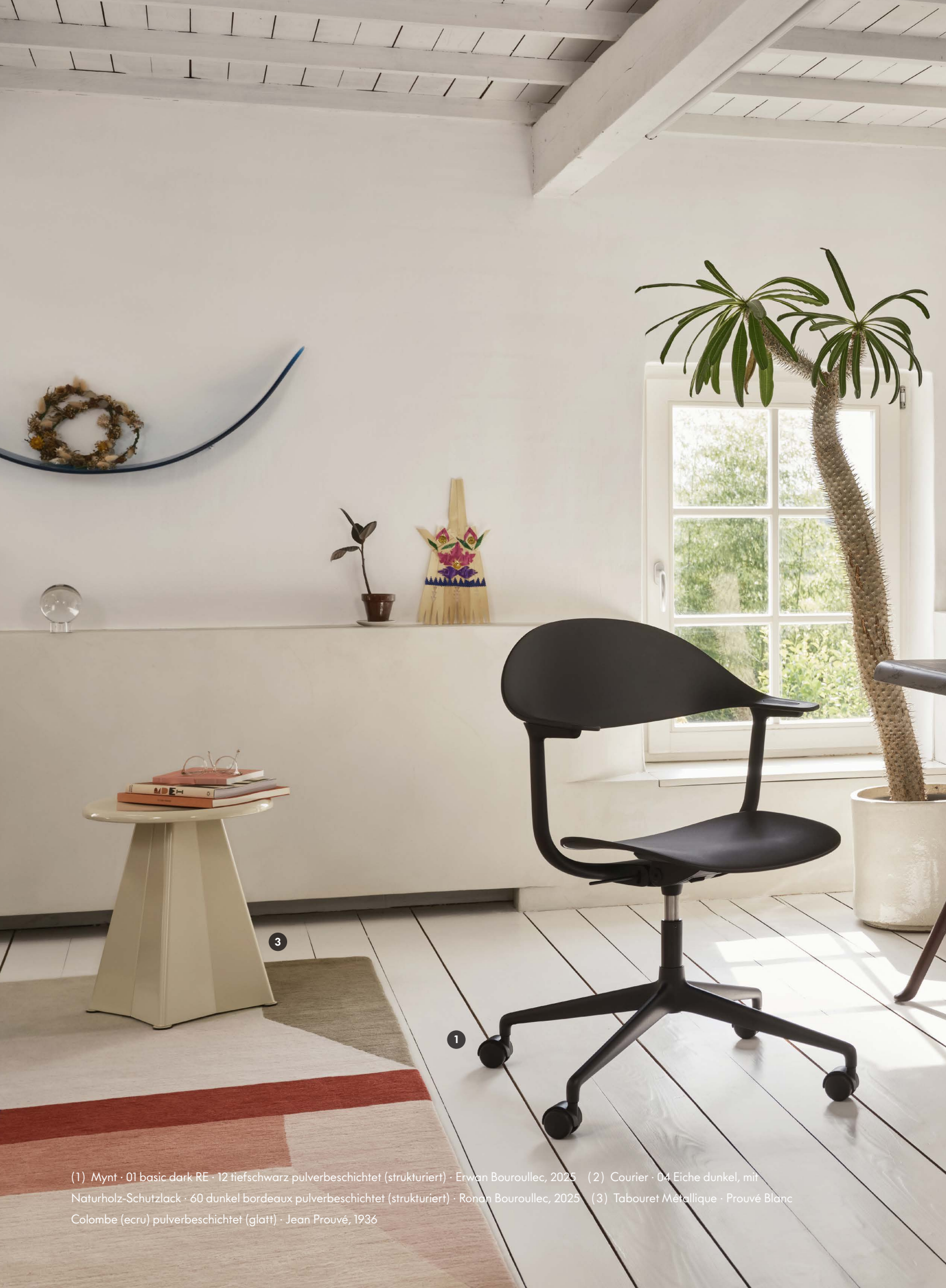
(1) Mynt · 01 basic dark RE · 12 tiefschwarz pulverbeschichtet (strukturiert) · Erwan Bouroullec, 2025 (2) Courier · 04 Eiche dunkel, mit Naturholz-Schutzlack · 60 dunkel bordeaux pulverbeschichtet (strukturiert) · Ronan Bouroullec, 2025 (3) Tabouret Métallique · Prouvé Blanc Colombe (ecru) pulverbeschichtet (glatt) · Jean Prouvé, 1936