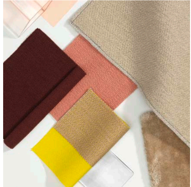
Vitra Cushions sind in abgestimmten Farbtönen erhältlich, passend zu allen sieben Farben der Sofabezüge.

In der gleichen Formensprache wie den 2006 vorgestellten und mittlerweile zu einem Klassiker avancierten Slow Chair haben Ronan und Erwan Bouroullec mit Vitra das Slow Sofa entwickelt. Mit seiner unverwechselbaren Form passt es in moderne Umgebungen – und in klassischen Einrichtungen setzt es einen zeitgemässen Akzent.